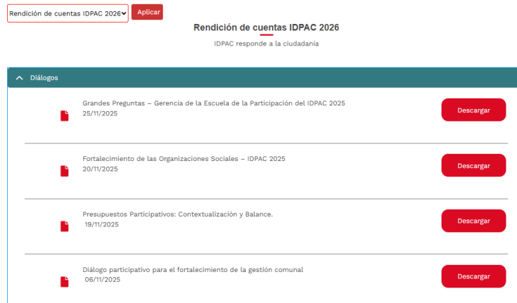
Ilustración 2. Rendición de cuentas del IDPAC -Diálogos