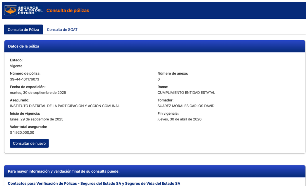
Ilustración 2 Consulta póliza de cumplimiento CTO 666-2025

Para mayor información y validación final de su consulta puede: