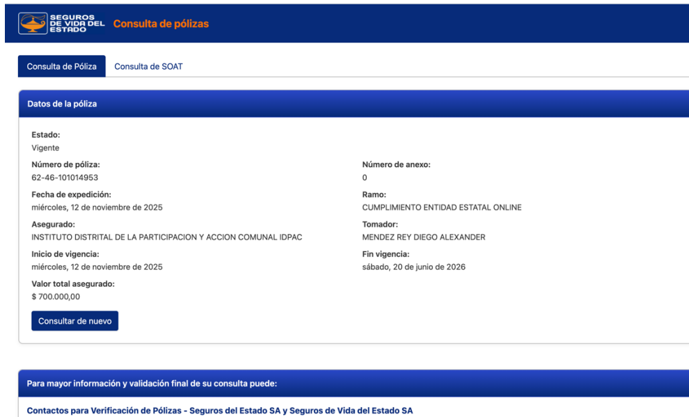
Ilustración 3 Consulta póliza de cumplimiento CTO 0816-2025