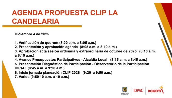
Agenda sesión CLIP La Candelaria diciembre 4 de 2025