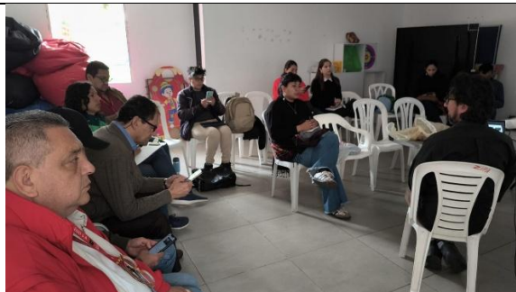
Fotografías sesión diciembre 4 de 2025 Comisión Local Intersectorial de Participación de La Candelaria en Casa Zipa