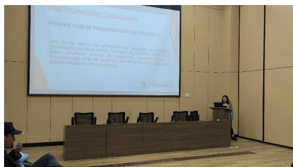
Fotografías sesión diciembre 2 de 2025 Comisión Local Intersectorial de Participación de Usme en la Alcaldía Local