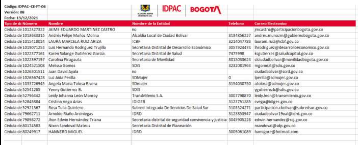
Imagen 3. Listado Asistencia CLIP localidad de Ciudad Bolívar mes de Octubre