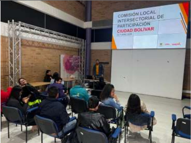
Imagen 2. Reunión CLIP localidad de Ciudad Bolívar mes de Octubre