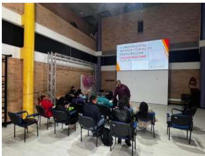
Imagen 1. Reunión CLIP localidad de Ciudad Bolívar mes de Octubre