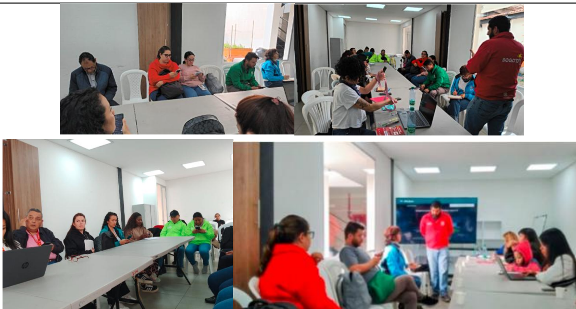
Fotografías sesión octubre 7 de 2025 Comisión Local Intersectorial de Participación de La Candelaria en Casa Zipa