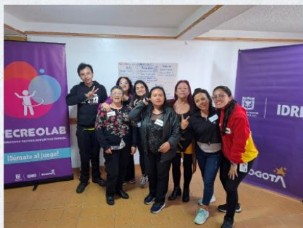
Parque San José San José