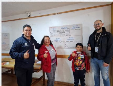
Danubio Sur Marruecos